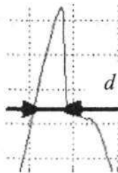
Рис. 1. Осциллограмма полупериода напряжения на варисторе 0,4 кВ ( f = 3,3 кГц)

Для уточнения динамических свойств ОПН выполнены испытания при воздействии напряжения повышенной частоты. На рис. 1 приведена осциллограмма полупериода напряжения на ОПН-0,4 при воздействии напряжения повышенной частоты 3,3 кГц.