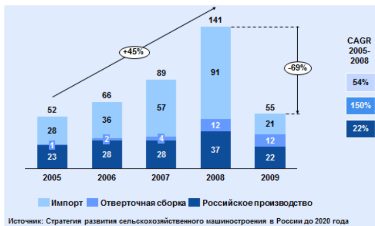
Рис. 3. Динамика российского рынка сельскохозяйственной техники, млрд р.

В 2009 г., наряду с сокращением объема рынка, произошло значительное уменьшение доли импорта. Это стало следствием трех факторов: девальвации рубля; повышения импортных пошлин на сельскохозяйственную технику с 5 до 15 %; реализации программы льготного кредитования на покупку отечественной техники. Сформировались все предпосылки для активного развития отечественных производителей и локализации иностранных производств.