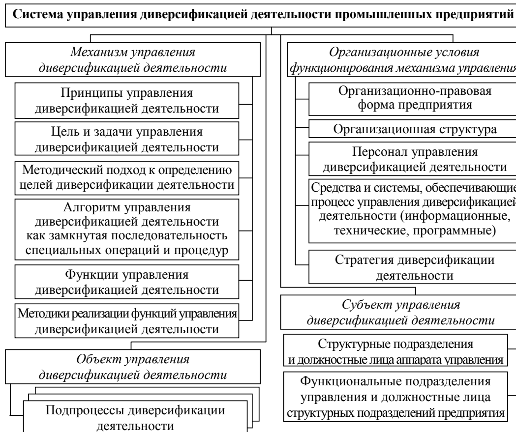
Рис. 3. Структура системы и механизма управления диверсификацией деятельности промышленных предприятий 3

Структура системы и механизма управления диверсификацией деятельности промышленных предприятий представлена на рис. 3.