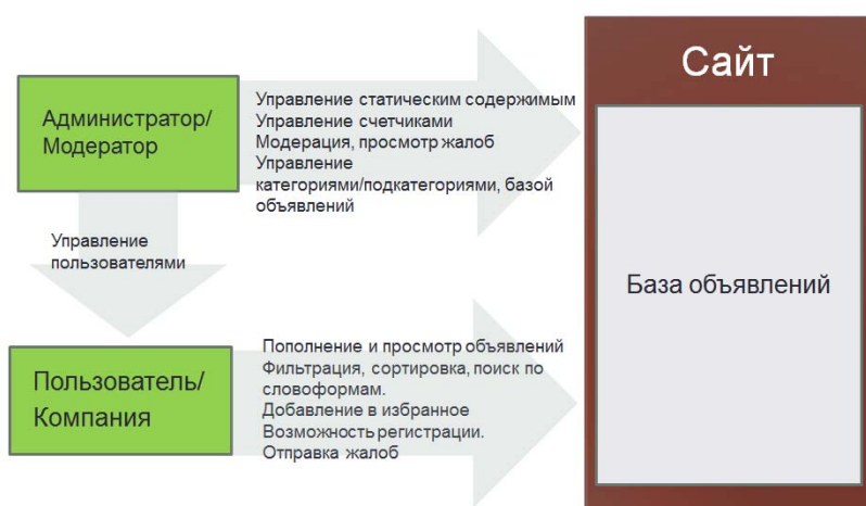
Рис. 1. Обобщенная модель web-приложения электронной доски объявлений

На рис. 1 представлена обобщенная модель Web-приложения электронной доски объявлений. На сайтах данной тематики существует два вида пользовательских групп: администраторы (модераторы) и собственно пользователи. Функциями пользователей являются: пополнение и просмотр объявлений, фильтрация, сортировка, поиск по словоформам, добавление объявления в избранное, возможность регистрации, отправка жалоб. Функциями администраторов являются: управление статическим содержимым, управление счетчиками объявлений, модерация, просмотр жалоб, управление категориями/подкатегориями, базой объявлений, управлением базой пользователей [1], [2].