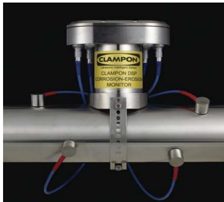
Мал. 2. Сістэма фіксаванага выяўлення ўнутрытрубных снарадаў ClampOn DSP

2. Сістэма фіксаванага выяўлення ўнутрытрубных снарадаў ClampOn DSP. Дадзеная сістэма уяўляе сабой стацыянарную прыладу, якая мантуецца непасрэдна на сценку трубаправода. Паводле [2], прынцып дзеяння прылады заснаваны на выкарыстанні інтэлектуальнага ўльтрагукавога датчыка. Датчык з высокай дакладнасцю вызначае праходжанне ўсіх тыпаў унутрытрубных снарадаў у рэальным часе, а таксама таўшчыню пласта смецця, які выштурхваецца ачышчальным снарадам, і выдае сігнал папярэджання аператару. Магчымая таксама ўсталёўка датчыкаў тэмпературы і паскарэння. Ультрагукавы датчык працуе адначасова на некалькіх частотах, што забяспечвае абарону ад ілжывых спрацоўванняў. Дадзеныя ад датчыкаў перадаюцца па кабелю на камп'ютар. Да вартасцяў сістэмы можна аднесці цалкам лічбавую апрацоўку сігналаў, ужыванне лічбавых сігнальных працэсараў, адсутнасць ўмяшання ў трубаправод, магчымасць усталёўкі ў агрэсіўных асяроддзях, захоўванне вымяральных інфармацыі ў т.з. «часопісе» да 60 дзён, здольнасць самадыягностыкі і гнуткасць сістэмы, праз тое, што адзін і той жа датчык можа выконваць выяўленне снарадаў, часціц і спектральны аналіз.