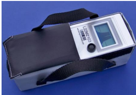
Мал. 3. Сістэма пошуку і сачэння за унутрытрубнымі снарадамі L22M

4. Сістэма пошуку і сачэння за ўнутрытрубнымі снарадамі TRAXALL 770. Сістэма TRAXALL 770 з'яўляецца найноўшай распрацоўкай кампаніі CDI ў галіне выяўлення і сачэння за ўнутрытрубнымі снарадамі і прызначана для працы, як сумесна з перадатчыкамі сямейства CD42, так і з перадатчыкамі аналагічных сістэм. TRAXALL 770 дазваляе выконваць адначасовае сачэнне за 7 снарадамі, перадатчыкі якіх працуюць на розных частотах. Прылада выкарыстоўвае лічбавы сігнальны працэсар для апрацоўкі атрыманых дадзеных. Магчыма выяўленне снарадаў з магнітамі сістэмы MFL. Пры набліжэнні снарада сістэма выдае гукавы сігнал. Сістэма абсталявана GPS-прыемнікам, які дазваляе вызначаць і запісваць каардынаты праходжання снарада ў пэўнай кропцы трубаправода. Прыёмная антэна інтэгравана з наземным прыладай. Магчыма ажыццявіць сувязь з камп'ютарам па інтэрфейсах Bluetooth і USB. Пры выкарыстанні TRAXALL 770 сумесна з радыёсістэмай CDI LineStat магчымы аўтаномны маніторынг праходжання ўнутрытрубных снарадаў з адпраўкай апавяшчэнняў ў выглядзе e-mail, або тэкставых паведамленняў. Радыёсістэма CDI LineStat не патрабуе наяўнасці сеткі сатавай сувязі і працуе ў любым пункце свету. Наземная прылада TRAXALL 770 прызначана для працы пры тэмпературы навакольнага асяроддзя ад -20 да +70 °C [4].