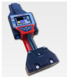
Мал. 4. Сістэма пошуку і сачэння за ўнутрытрубнымі снарадамі TRAXALL 770

4. Сістэма пошуку і сачэння за ўнутрытрубнымі снарадамі TRAXALL 770. Сістэма TRAXALL 770 з'яўляецца найноўшай распрацоўкай кампаніі CDI ў галіне выяўлення і сачэння за ўнутрытрубнымі снарадамі і прызначана для працы, як сумесна з перадатчыкамі сямейства CD42, так і з перадатчыкамі аналагічных сістэм. TRAXALL 770 дазваляе выконваць адначасовае сачэнне за 7 снарадамі, перадатчыкі якіх працуюць на розных частотах. Прылада выкарыстоўвае лічбавы сігнальны працэсар для апрацоўкі атрыманых дадзеных. Магчыма выяўленне снарадаў з магнітамі сістэмы MFL. Пры набліжэнні снарада сістэма выдае гукавы сігнал. Сістэма абсталявана GPS-прыемнікам, які дазваляе вызначаць і запісваць каардынаты праходжання снарада ў пэўнай кропцы трубаправода. Прыёмная антэна інтэгравана з наземным прыладай. Магчыма ажыццявіць сувязь з камп'ютарам па інтэрфейсах Bluetooth і USB. Пры выкарыстанні TRAXALL 770 сумесна з радыёсістэмай CDI LineStat магчымы аўтаномны маніторынг праходжання ўнутрытрубных снарадаў з адпраўкай апавяшчэнняў ў выглядзе e-mail, або тэкставых паведамленняў. Радыёсістэма CDI LineStat не патрабуе наяўнасці сеткі сатавай сувязі і працуе ў любым пункце свету. Наземная прылада TRAXALL 770 прызначана для працы пры тэмпературы навакольнага асяроддзя ад -20 да +70 °C [4].