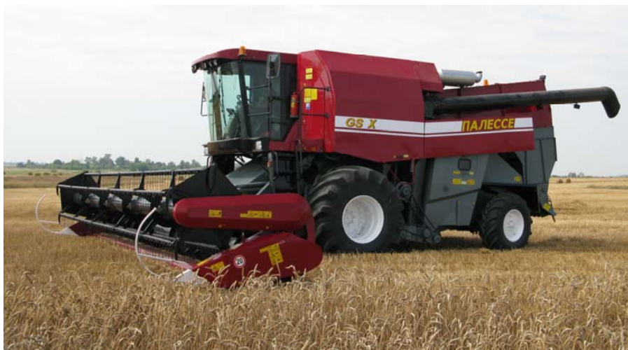
Рис. 1. Зерноуборочный комбайн КЗС-1624

шин, моделирование и оптимизация воздушных потоков и процесса разделения мелкого зернового вороха на фракции в системе очистки зерноуборочного комбайна, моделирование процесса транспортировки технологической массы в технологическом тракте кормоуборочного комбайна и др.