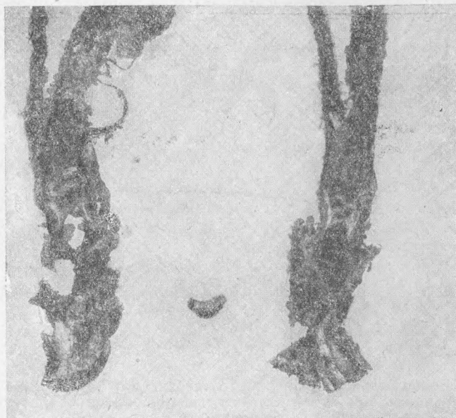
Фиг. 3.—Молодые цветоносные побеги, пораженные дуплистостью. В центре личинка скрытохоботника.

Такие погибшие кусты не имеют центральных дупел, что долгое время служило возражением против энтомологических причин заболеваний.