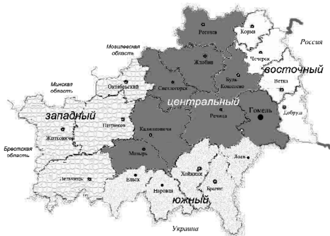
Рис. 3. Рекреационное районирование Гомельского региона

Предложенная методика определения туристской специализации административных районов, схема многофакторного районирования могут быть использованы и в других регионах Республики Беларусь. Результаты исследований адресованы организаторам туристской деятельности для разработки специализированных туров и проектов рекреационного освоения территории региона.