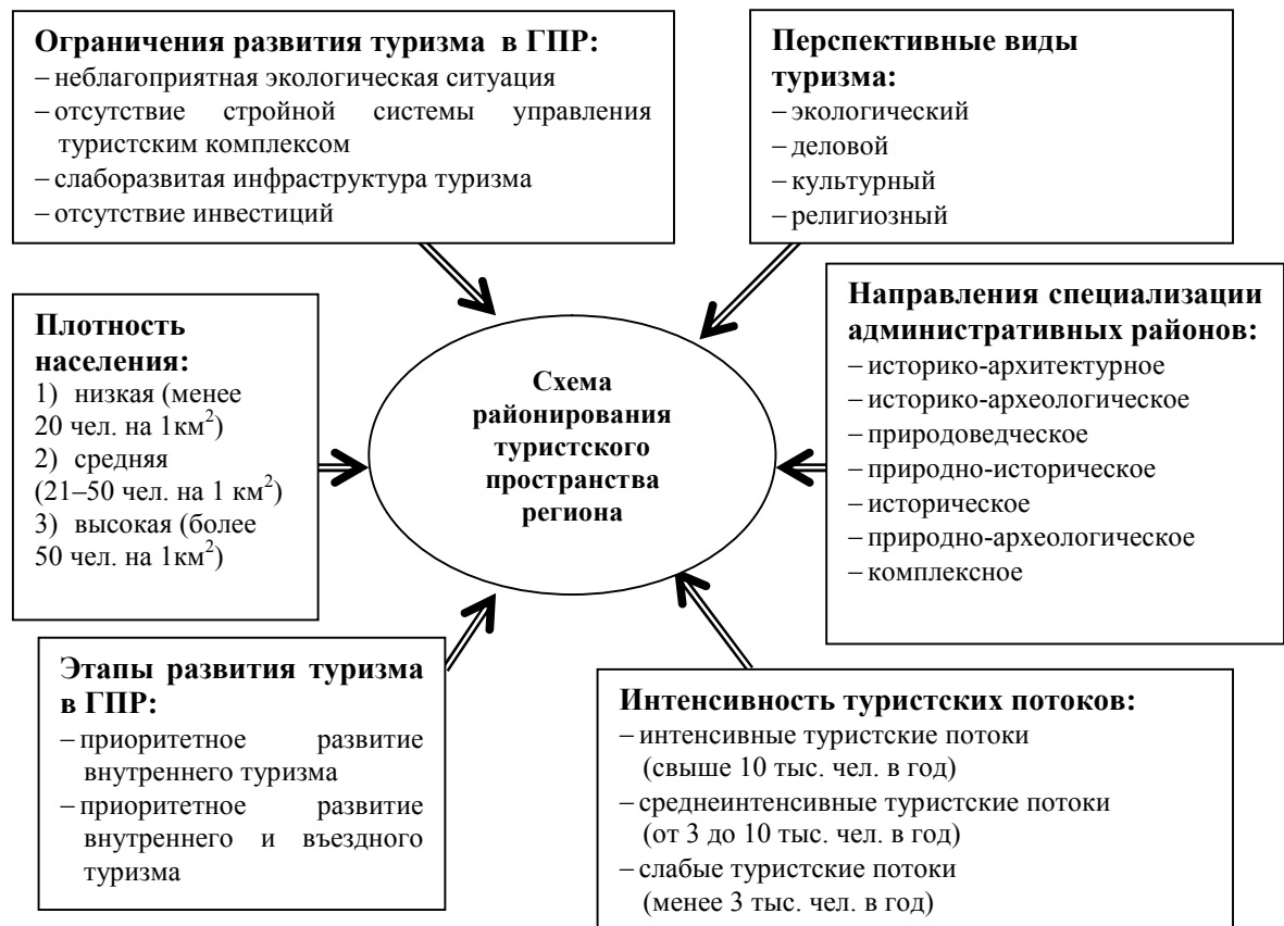
Рис. 2. Схема многофакторного районирования

К западному подрегиону относятся Житковичский, Петриковский, Октябрьский, Лельчицкий районы. Для него характерна невысокая плотность населения, средняя и слабая интенсивность туристских потоков, природоведческое направление туристской специализации, наличие условий для развития экологического туризма, слаборазвитая материально-техническая база туризма, наличие предпосылок для приоритетного развития внутреннего туризма.