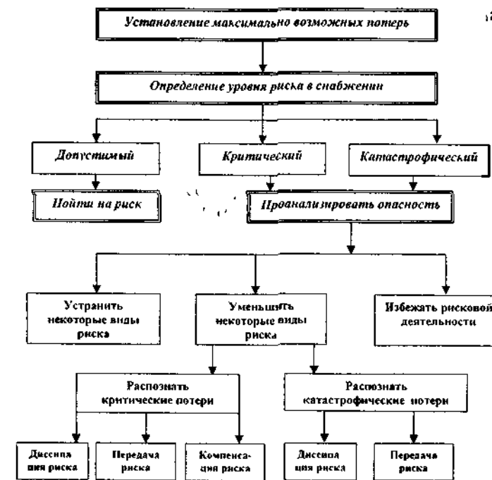
Рис. 1. Предлагаемая схема использования методов снижения риска при установлении хозяйственных связей

направленный на разработку процедур предупредительного либо локализирующего характера, содержащих в себе конкретные рекомендации по устранению или минимизации возможных потерь. Первоначальным шагом к минимизации потерь от риска при установлении хозяйственных связей является использование методов защиты от него. В качестве исходной базы применения того или иного метода может быть использована схема, представленная на рис. 1.