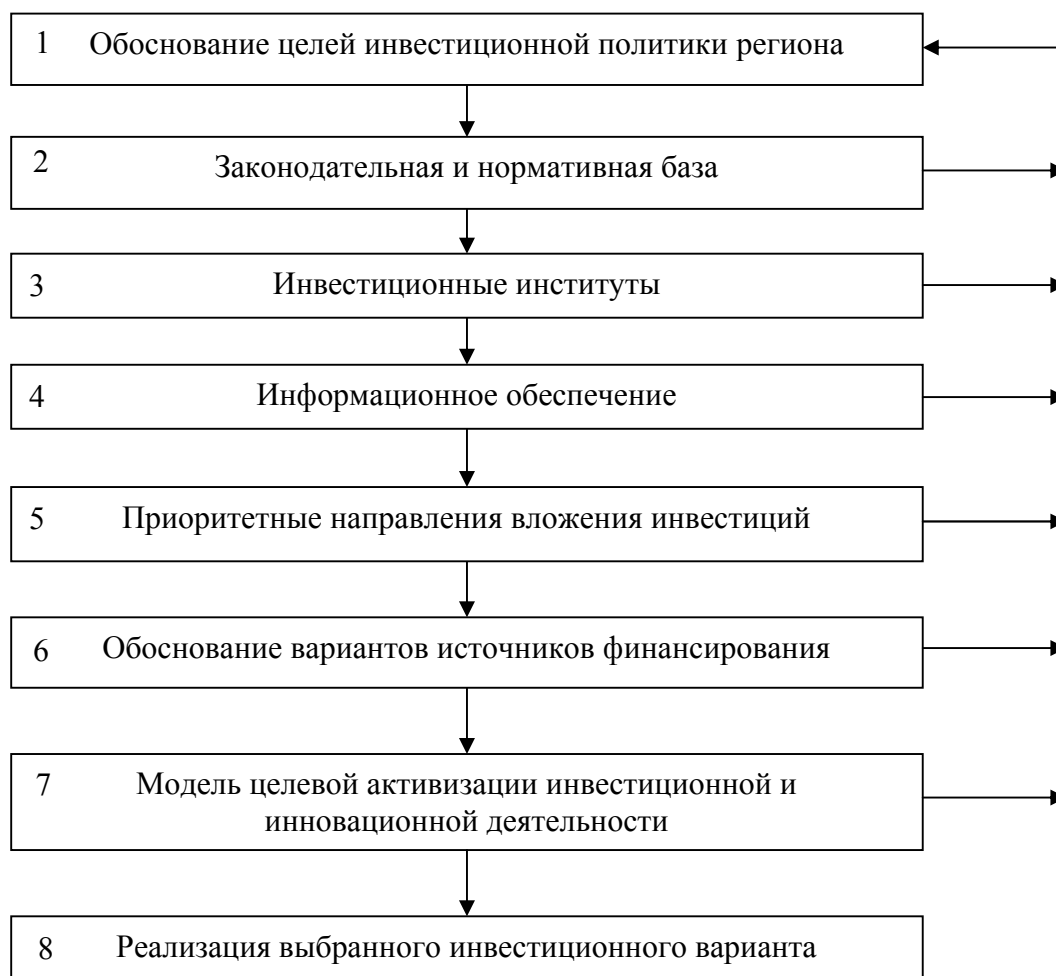
Рис. 1. Типовая модель формирования инвестиционной политики региона

2. Формирование базы данных по инвестиционным проектам, прошедшим региональную экспертизу.