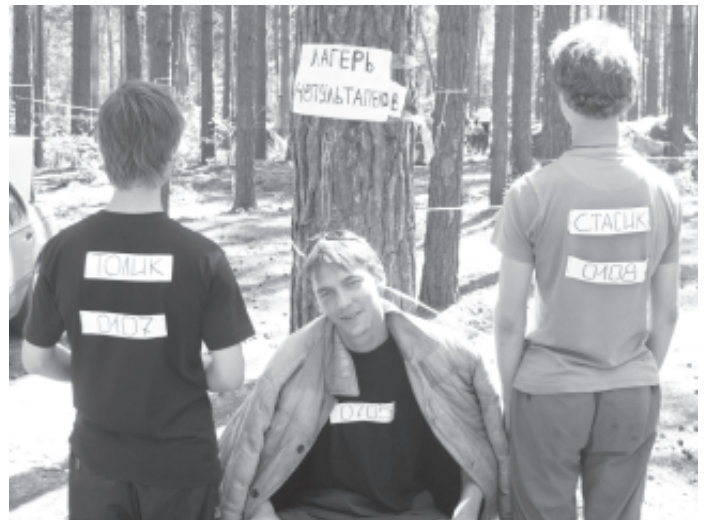
Представители сборной команды ГГТУ им. П.О.Сухого «ЧЕПУЛЬТОПЕКИ»

А откроет наш конкурс фотография, где показано как провели лето-2006 наши студенты на фестивале «Студенческая жара», организованном ОО «БРСМ».