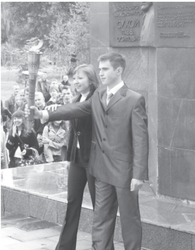
Студенты-пятикурсники передают первокурсникам огонь знаний