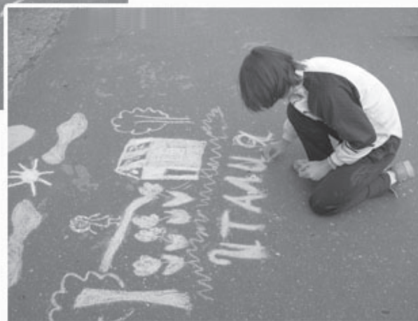
Конкурс рисунков среди воспитанников Улуковской школы-интернат

мышки», и в «Третьего лишнего». Задорный детский смех просто греет душу. А когда мы объявили конкурс рисунка на асфальте, то настолько быстро разобрали у нас цветные мелки, что мы и глазом моргнуть не успели. Каждый ребенок старался нарисовать самый красивый рисунок. Здесь тебе и мишки, и домики, и море с песком... Трудно нам было выбрать три самых лучших работы.