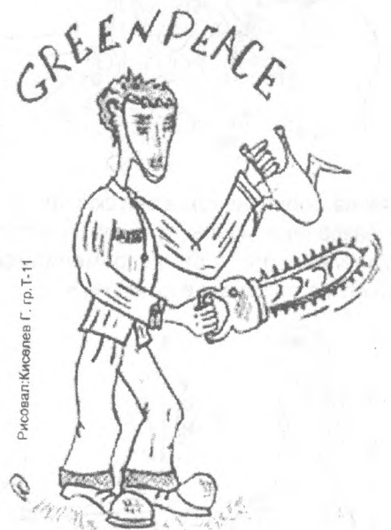
Рисовал: Киселев Г. гр. Т-11

прокомментировали так: «О, ужас, ужас... Было очень холодно и щекотно...». (Оля) «У меня уже был опыт работы...». (Яна) «Когда я выходила на сцену я чуть-чуть сбилась». (Галя) «... но на нас были прозрачные юбки, которые предавали нам уверенности в себе». (Маша)