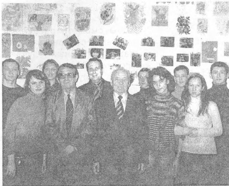
на выставке творческих работ детей