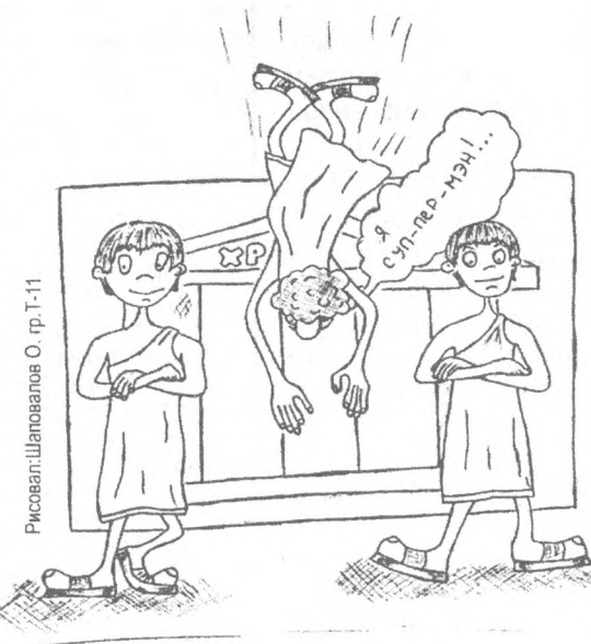
Рисовал: Шаповалов О. гр. Т-11