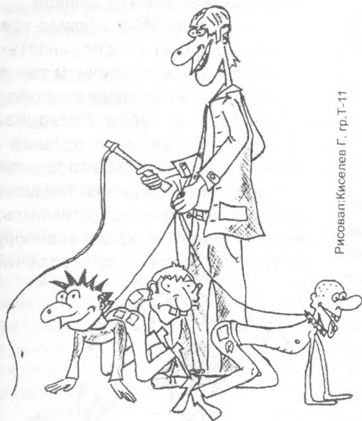
Рисовал: Киселев Г. гр. Т-11

BODY ART удивил многих, и вот мнение одной из этих многих: «Когда я увидела девушек в черных плащах, то подумала, что это будет