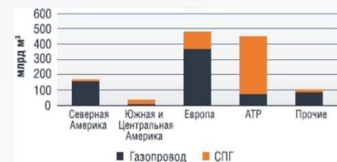
РИСУНОК 3 - СТРУКТУРА ИМПОРТА ГАЗА ПО ВИДАМ ПОСТАВОК В МЕЖДУНАРОДНОЙ ТОРГОВЛЕ ЗА 2022 ГОД

Тенденция развития рынка СПГ свидетельствует о дальнейшем стабильном формировании этой инфраструктуры и росте данного рынка за счет развития во всех частях данной цепи.