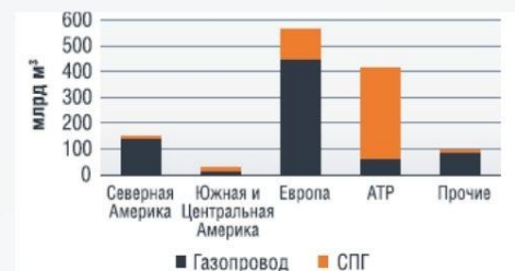
РИСУНОК 2 - СТРУКТУРА ИМПОРТА ГАЗА ПО ВИДАМ ПОСТАВОК В МЕЖДУНАРОДНОЙ ТОРГОВЛЕ ЗА 2021 ГОД

В 2022 году произошло сокращение импортных поставок природного газа на 7%. Сокращение поставок газа по газопроводам на рынок Европы связан с энергетическим кризисом 2021 года.