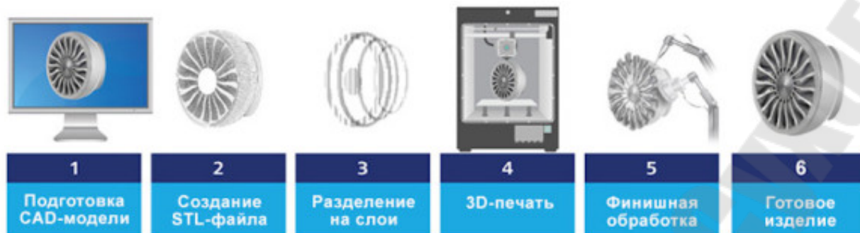
Рисунок 1.2 - Примерные этапы изготовления трехмерного изделия 3

При этом главное внимание должно быть сосредоточено на новых передовых технологических процессах и целесообразности их применения в рассматриваемых условиях 45 .