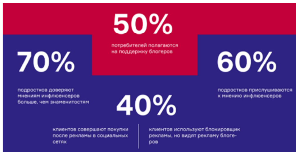
Рис. 1. Отношение людей к инфлюенс-маркетингу [2]

Отношение людей к инфлюенс-маркетингу представлено на рис. 1.