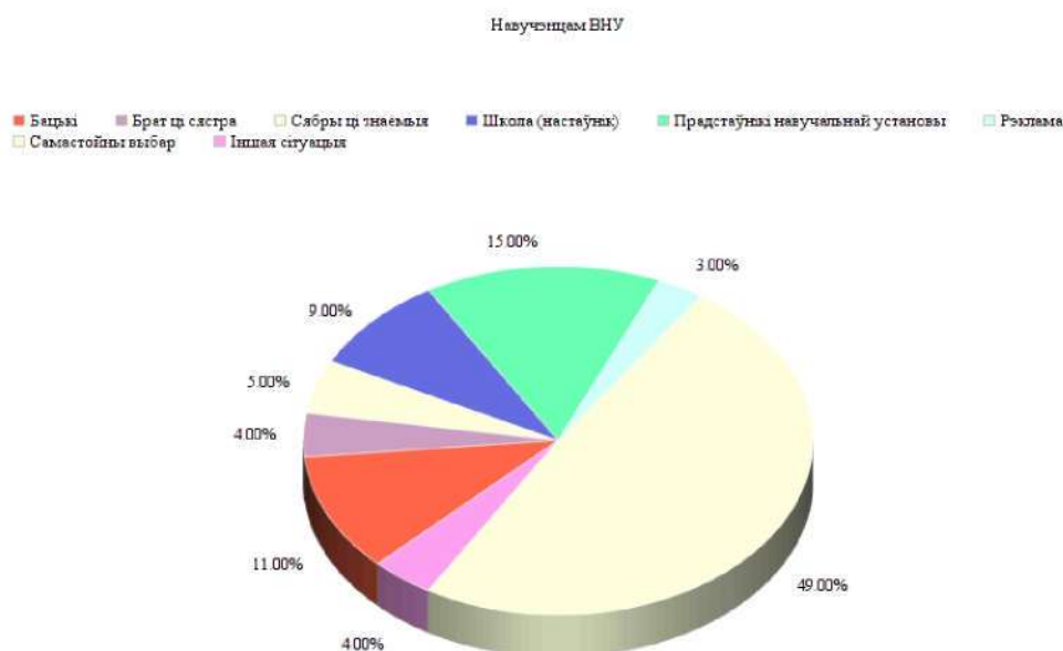
Дыяграма № 1 «Фактары ўздзеяння на прафесійнае самавызначэнне»

Такім чынам, сацыялагічны агляд за 2017-2018 гады, праведзены ў Беларусі, пацвярджае, што сярод фактараў, якія ўздзейнічаюць на прафесійнае самавызначэнне, беларуская моладзь указвае знаёмых, школу, прадстаўнікоў прафесійных вучэбных устаноў, бацькоў, сяброў, рэкламу і самастойны выбар. А самымі папулярнымі прафесіямі беларускай моладзі з'яўляюцца праграмісты, урачы (стаматолагі), прадпрымальнікі і бізнесмены, юрысты і менеджары (глядзі ніжэй дыяграмы № 1, № 2).