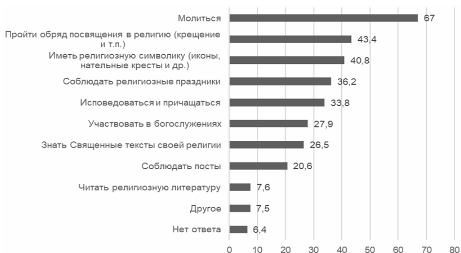
Рис. 3. Распределение ответов на вопрос «Выберите, пожалуйста, не более 5 позиций, которые, на Ваш взгляд, должен соблюдать верующий человек», %

Показатели религиозной активности определяются через включенность в систему культовых практик и соблюдение норм религиозного и повседневного благочестия. Принадлежность к религиозному типу в общественном сознании в первую очередь ассоциируется с необходимостью совершения индивидуальных религиозных практик (молитв). Вторая группа обязательств, которые, по мнению респондентов, обязательны для религиозного человека, представлена обрядовыми практиками перехода в религию (крещение и т. п.) и соблюдением норм повседневного благочестия (наличие религиозной символики). Третью группу необходимых условий образуют внешние формы соблюдения религиозного благочестия – участие в религиозных праздниках и отправлении обрядов (исповедь и причащение).