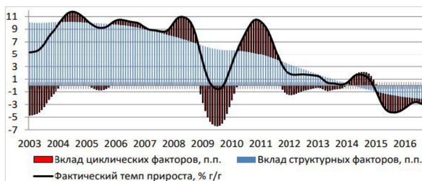
Рис. 1. Вклад структурных и циклических факторов в прирост ВВП [1]

Когда причинами снижения производительности являются внешние эффекты, то по мере уменьшения их влияния и формирования положительной его направленности можно рассчитывать на стабилизацию уровня ОФП и ее рост. Если же снижение ОФП связано в том числе с какими-либо внутренними механизмами, то нейтрализация потерь ОФП более сложна. Главными причинами спада называют: ухудшение условий торговли для Беларуси, в том числе снижение цен на нефть. А именно: