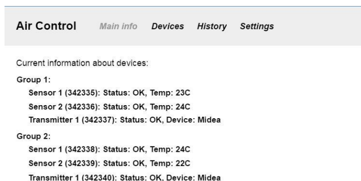
Рис. 2. Главная страница веб-приложения

прошивки, поэтому для расширения поддержки достаточно просто обновить прошивку устройства (рис. 3).