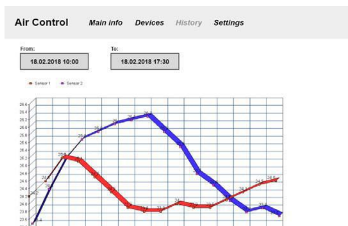
Рис. 4. Просмотр истории показаний

Приложение позволяет вывести графики показаний за некоторый период времени, который выбирается пользователем на странице (рис. 4). Для дальнейшего использования показания могут быть экспортированы в виде графика либо таблицы в различных форматах: CSV, XLSX, PDF, PNG.