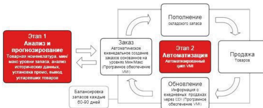
Рис. 2. Этапы реализации технологии VMI [2]

На первом этапе осуществляются такие процессы, как [2]: