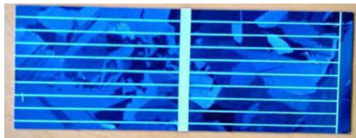
Рис. 1. Эталонный солнечный элемент, используемый в учебном стенде в качестве датчика энергетической освещенности

Одним из обязательных структурных элементов учебно-лабораторного стенда «Исследование характеристик солнечных панелей» является датчик уровня солнечной радиации (энергетической освещенности), в качестве которого можно использовать небольшой эталонный солнечный элемент (рис. 1).