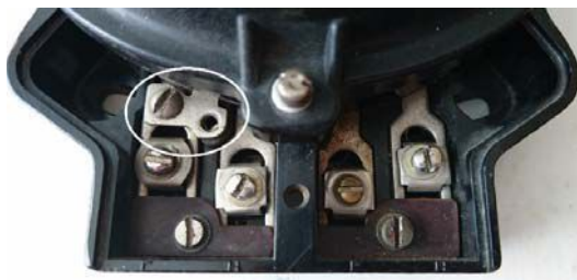
Рис. 2. Отсутствие на счетчике крышки клеммной колодки или пломбы

Первый способ – отсутствие на счетчике крышки клеммной колодки или пломбы (рис. 2). Если по каким-то причинам на счетчике отсутствует крышка клеммной колодки счетчика или пломба на ней (это часто допускают по невнимательности), то самый простой способ остановить счетчик – это отпустить винт напряжения в однофазных и отвинтить перемычки между 1-й и 2-й, 4-й и 5-й, 7-й и 8-й клеммами в трехфазных счетчиках.