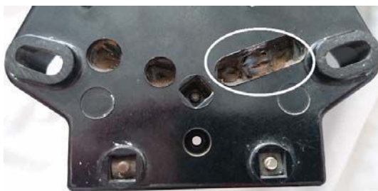
Рис. 4. Хищение электроэнергии с помощью изменения месторасположения шунта

В Республике Беларусь за несанкционированное подключение, а также за вред, причиненный энергосистеме, предусмотрена административная ответственность. Руководствуясь ст. 20.10 Кодекса об административных правонарушениях Республики Беларусь (далее – КоАП РБ) о нарушении правил пользования электрической или тепловой энергией, самовольное подключение приемников электрической или тепловой энергии, либо безучетное потребление такой энергии, либо повреждение расчетных приборов учета расхода такой энергии или нарушение схем их подключения, а равно иные нарушения правил пользования электрической или тепловой энергией влекут наложение штрафа в пятикратном размере от суммы причиненного ущерба.