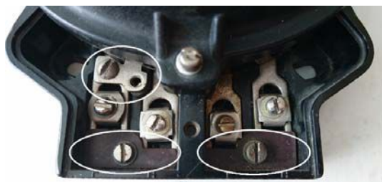
Рис. 3. Хищение электроэнергии с помощью самодельного шунта

Третий способ – хищение электроэнергии с помощью изменения месторасположения шунта (рис. 4): шунт можно поместить в углубление между 1-й и 2-й клеммами с обратной стороны счетчика, которое залито битумом. После «доработки» заливку надо восстановить. Если удастся развернуть счетчик, то это можно проделать, не срывая пломб [4].