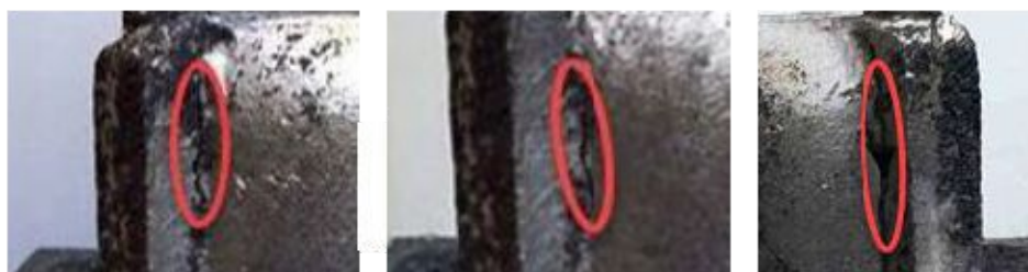
Образец № 2

При визуальном осмотре полученных отливок выявлены трещины на трех образцах: № 2–4 (рис. 2).