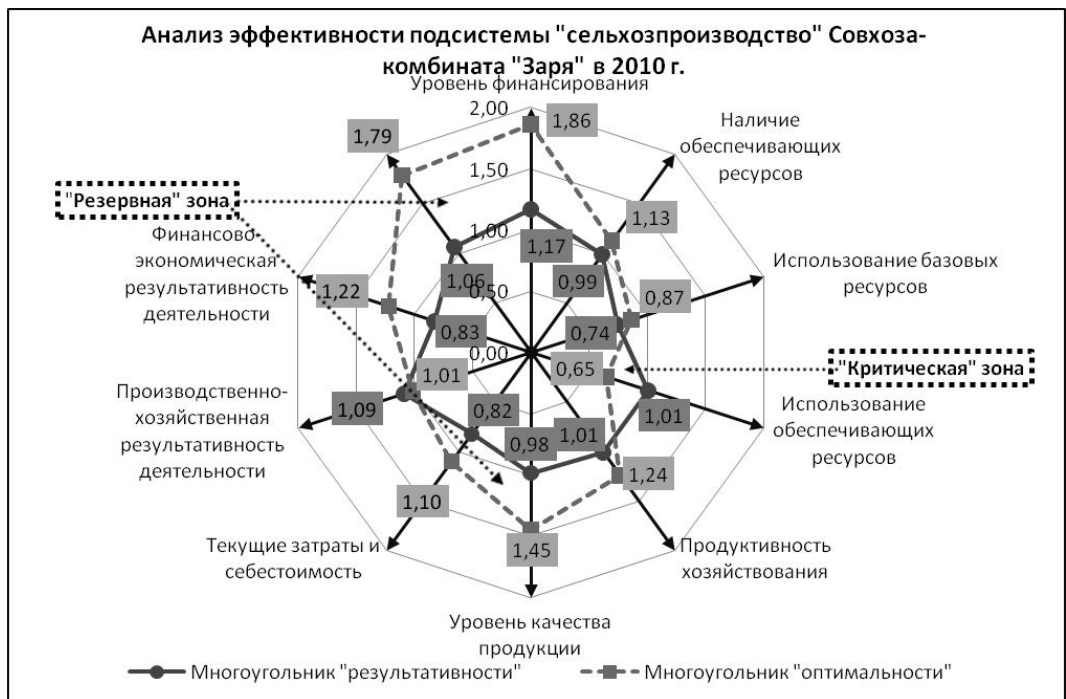
Рис. 2. Графическое представление результатов анализа в разрезе стадий воспроизводственного процесса

Графический анализ проводится путем построения аналитических многоугольников в единой системе координатных осей (рис. 2). Координаты парных параметров "результативности" и "оптимальности" определяются величиной аналогичных частных коэффициентов.