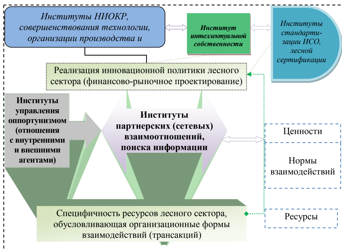
Рис. 2. Наполнение лесного сектора экономическими институтами в целях инновационного развития

Считается, что в Беларуси главным образом создана организационно-правовая база в виде кодексов для качественного государственного управления. Предложения о создании института оценки регулирующих действий, на наш взгляд, должны базироваться на отраслевых и организационных отличиях систем мезоуровня. Выбор в качестве вектора развития инноваций предполагает изначально последовательную организационную наполняемость лесного сектора экономическими институтами: управления эндогенными (между лесным хозяйством и лесной промышленностью) трансакциями, аналитических и информационно-сетевых коммуникаций, партнерства и др. (рис. 2).