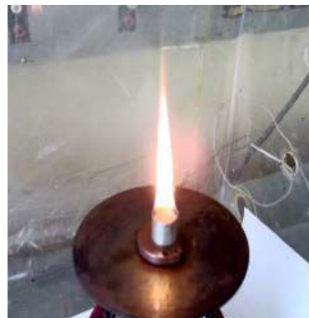
Рис. 2. Горение бензина без электрического поля