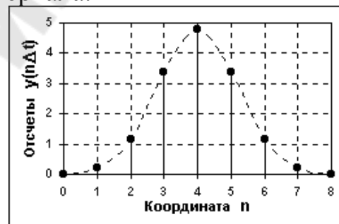
Рис.1. Вид непрерывного сигнала