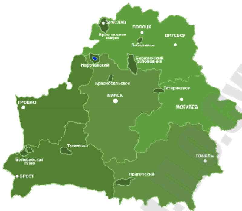
Рисунок 2 – Особо охраняемые природные территории РБ