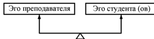
Рис. 2. Эго-весы

Преподаватель – тоже человек, и потому «ничто человеческое нам не чуждо». В связи со сказанным я предлагаю следующую модель.