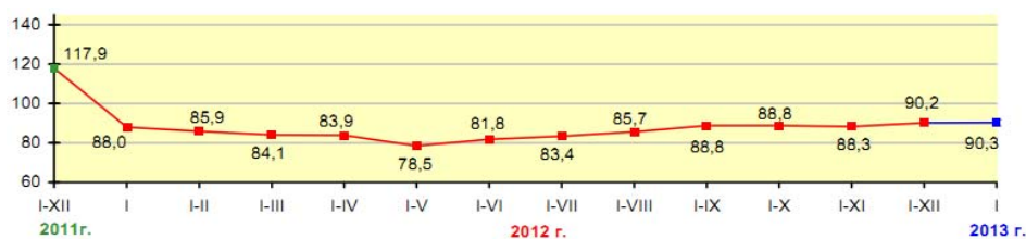
Рис. 2. Динамика инвестиций в основной капитал, в % к соответствующему периоду предыдущего года; в сопоставимых ценах

За этот период инвестиции на приобретение машин, оборудования, транспортных средств составили 3,1 трлн р., или 40,7 % от общего объема инвестиций и 83,3 % – к январю 2012 г. На долю импортных машин, оборудования, транспортных средств приходится 55,1 % этих инвестиций. Из импортного оборудования 28,3 % приобретено на территории Республики Беларусь.