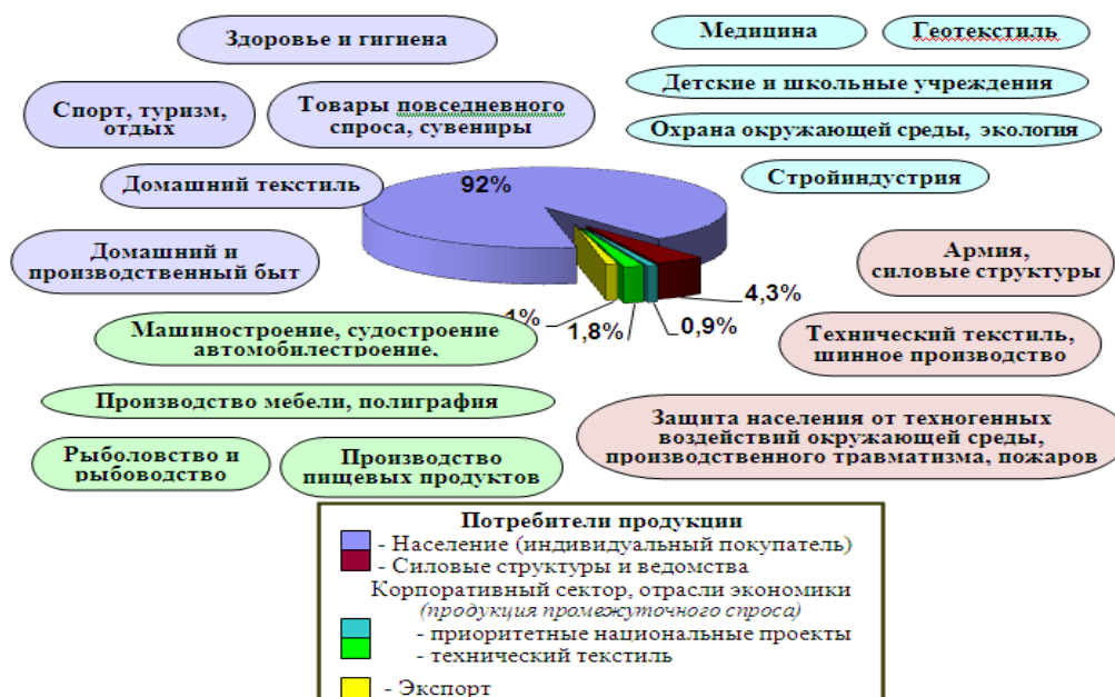
Рис. 1. Области применения и структура потребления продукции легкой промышленности

Легкая промышленность входит в состав ведущих отраслей мирового промышленного комплекса. На ее долю приходится 5,7 % мирового валового продукта, более 14 %, занятых в промышленном комплексе. Активизация торговли между странами, вовлечение в международный товарооборот все новых государств и территорий изменяют мировой рынок и усиливают международную конкуренцию в сфере производства и насыщения рынка товарами повседневного спроса, продукцией технического назначения. Мировая легкая промышленность характеризуется постоянным экономическим ростом, связанным с увеличением населения земли, повышением его благосостояния и покупательной способности. Соответственно, и мировой рынок продукции легкой промышленности развивается динамично.