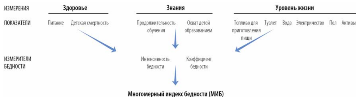
Рис. 4. Схема расчета многомерного индекса бедности

3. Многомерный индекс бедности (МИБ) (рис. 4) – представляет инструмент, с помощью которого измеряются межстрановые различия людей по критерию доступности к сохранению здоровья, получению образования и обеспечению достойного образа жизни. Его величина зависит от количества соответствующих ограничений и количества людей, их испытывающих.