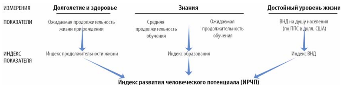
Рис. 1. Схема расчета индекса развития человеческого потенциала

Схематично система оценки человеческого потенциала выглядит следующим образом (рис. 1).