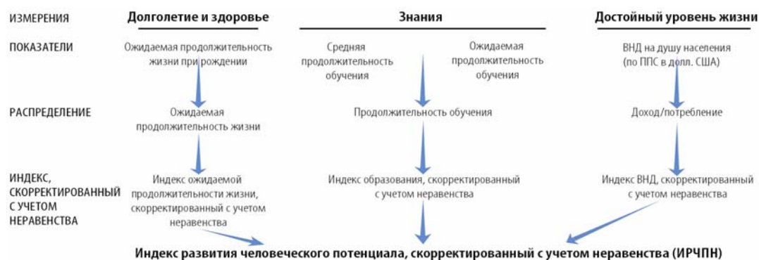
Рис. 2. Схема расчета индекса социально-экономического неравенства

1. Индекс развития человеческого потенциала, с учетом внутристранового неравенства (ИРЧПН) (рис. 2) – представляет собой сводный показатель достижений страны в области человеческого развития по трем основным измерениям: здоровью, образованию и доходам, с учетом неравенства в получении общественных благ населения в пределах одной страны.