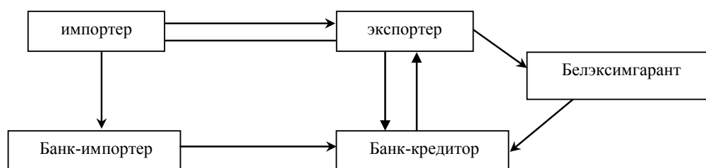
Рис. 2. Предлагаемая схема государственного страхования экспорта

Данный шаг позволит значительно упростить и сократить сроки (до 14 дней) совершения процедуры экспортного страхования белорусской продукции (рис. 2).