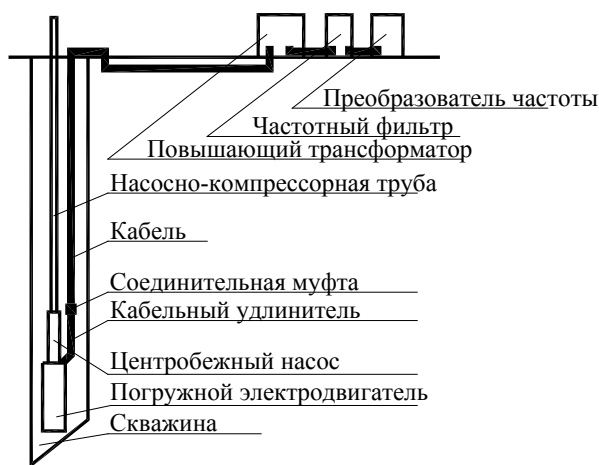
Рис. 1. Упрощенная схема конструктивного исполнения нефтедобывающей станции

Упрощенная схема конструктивного исполнения частотно-регулируемого электропривода погружного насоса на основе станции управления типа «Борец» приведена на рис. 1.