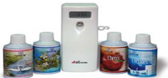
Рис. 1. Автоматический (электронный) ароматизатор воздуха «Spring Air»

Поскольку офисы туристских организаций небольшие по размеру, то эффективным будет использование компактного диспенсера «Spring Air» (рис. 1).